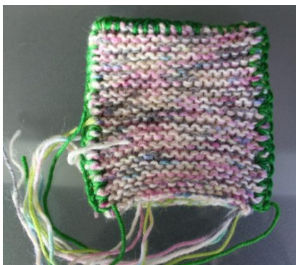
Und so sieht es von hinten aus....